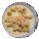
Gnocchi al Gorgonzola